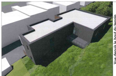
Vue depuis le haut du terrain